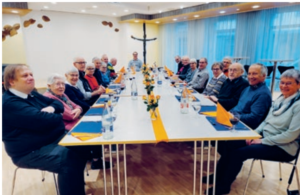
Neujahrsgrossgottesdienst der Kolpingfamilie Altstätten.

Am Sonntag, 10. März, laden die katholische und die evangelische Kirchgemeinde zum gemeinsamen Suppentag ein. Der ökumenische Gottesdienst findet um 10.00 Uhr in der katholischen Pfarrkirche statt. Anschliessend wird auf dem Kirchplatz Suppe – wer möchte, auch zum Mitnehmen – verteilt.